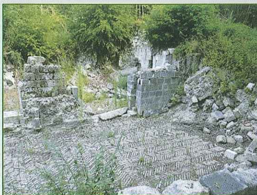
Chiesa di S. Pancrazio

La città di epoca medievale fu ristrutturata ed abbellita in epoca rinascimentale dall'architetto Antonio da Sangallo il Giovane , su incarico della famiglia Farnese, che nel 1537 creò il Ducato di Castro e lo resse fino al 1649, anno in cui la città capitale del dominio Farnesiano fu distrutta per ordine di papa Innocenzo X.