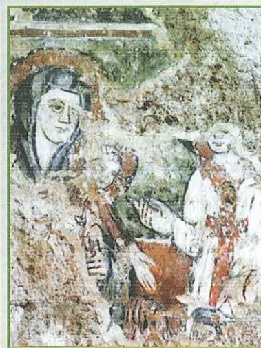
Affresco chiesa S. Maria intus civitatem

risalente al VI secolo a.C., le cui decorazioni scultoree si possono ammirare nel Museo Civico e la famosa "Tomba della Biga", anche questa risalente al VI secolo a.C., che prende il nome dall'eccezionale ritrovamento al suo interno di una biga etrusca da parata.