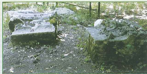
Capitelli della facciata della Zecca

Lungo il sentiero emergono dal bosco le rovine degli edifici